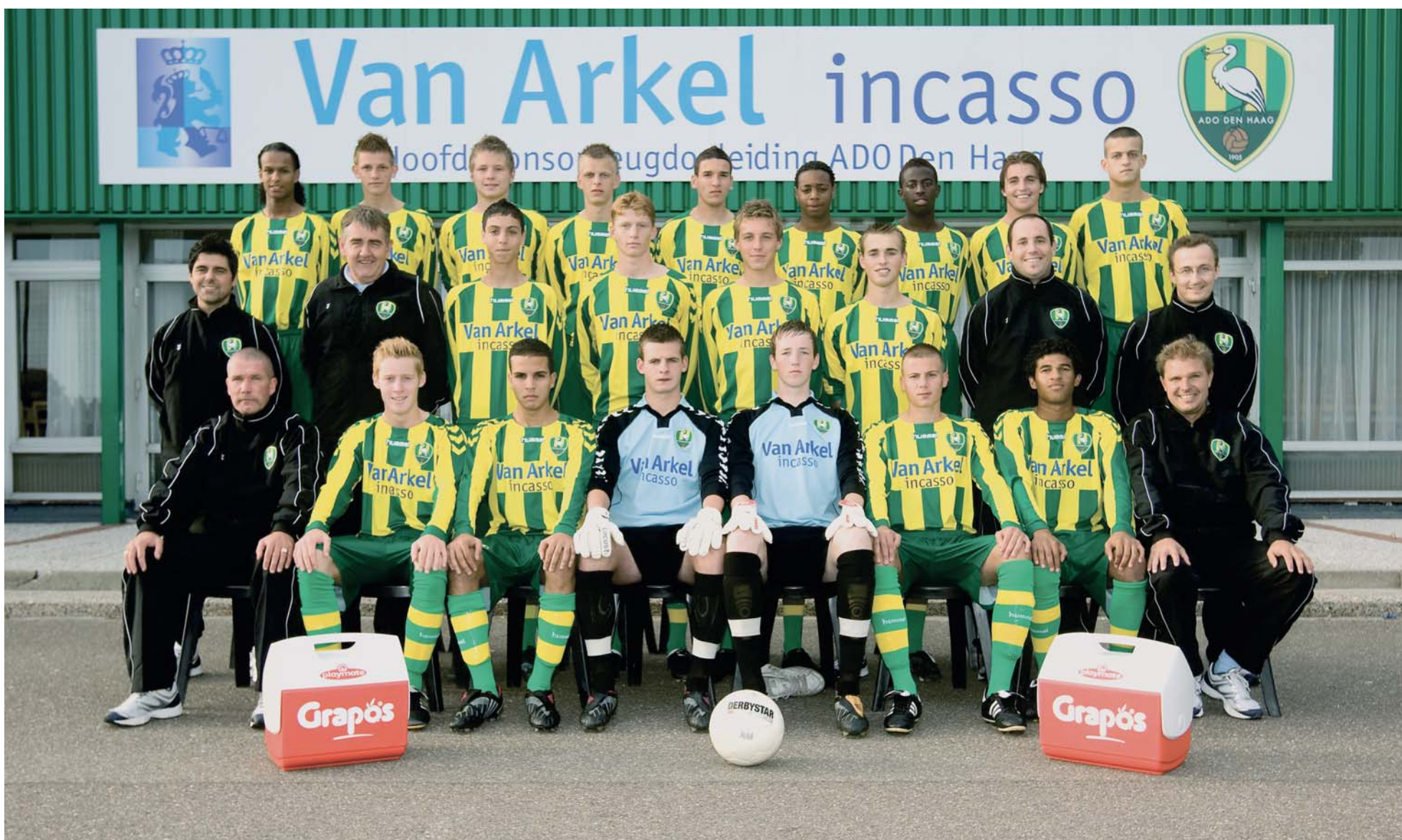
OVERIGE ADO DEN HAAG TEAMS: